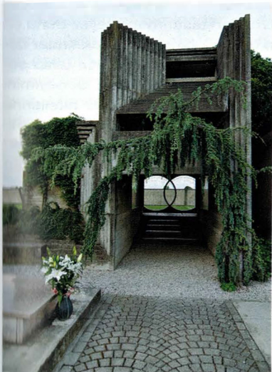
2. Tomba Brion Cemetery, Treviso, İtalya, 1970, Mimar: Carlo Scarpa