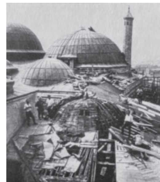
Mualla Eyüboğlu Anhegger restaurierte 1961–71 den umfangreichen Haremstrakt des Topkapı-Palasts in Istanbul. Foto: Hitit Güneşi. Mualla Eyüboğlu Anhegger (2003), S. 135