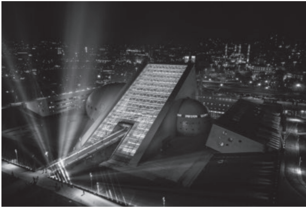
Semra und Özcan Uygur entwarfen das neue zum Atatürk-Kulturzentrum in Ankara gehörende Konzertsaalgebäude des Symphonieorchesters des Präsidenten der Republik (1992–2020).