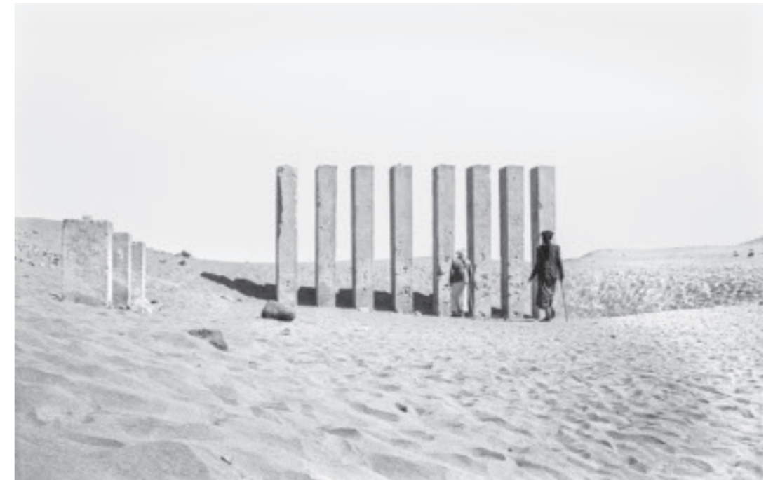
Jemen, Von Sanaa nach Ma'rib 1987

Der Werkzyklus „Ricebarn Lumbung, Tana Tovaja“ belegt auf anschauliche Weise, dass sich zumindest noch 1983, als die Aufnahmen entstanden, praktisch das gesamte soziale Leben auf Sulawesi, Indonesien, auf erhöhten offenen Plattformen unter den Reisspeichern mit ihren ausladenden Dächern abspielte. Ob bzw. warum das heute nicht mehr so ist, darüber verraten die hier teilweise wie Filmstills wirkenden Fotos leider nichts. Das sieht beim Werkzyklus „15 km entlang der georgisch-aserbaidschanischen Grenze“ ganz anders aus, denn hier gibt die Fo-