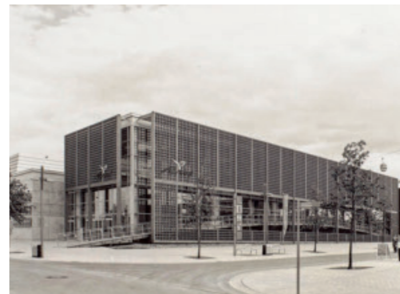
Melkan Gürsel und Murat Tabanlıoğlu entwarfen den türkischen Pavillon für die Expo 2000 in Hannover.